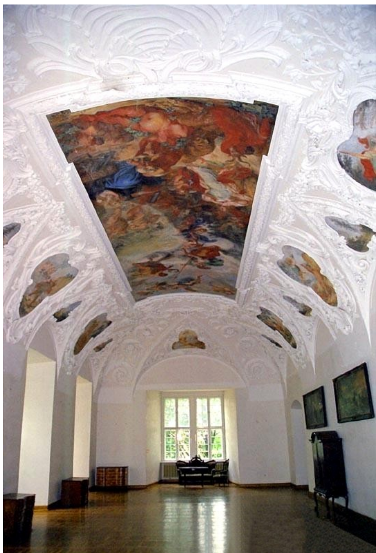
Bentum podobnie ozdobił bibliotekę klaszorną i wykonał plafon w głównej sali reprezentacyjnej pałacu –

Sali Książęcej, a w 1737- 1739 Franz Mangoldt ozdobił zespołem posągów założony w 1649 przez opata Freibergera ogród opacki oraz wyrzeźbił szereg dzieł do Sali Książęcej.